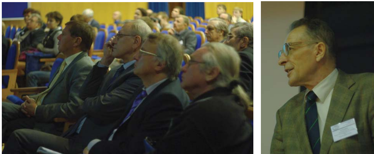
Рис. 3. На пленарном докладе