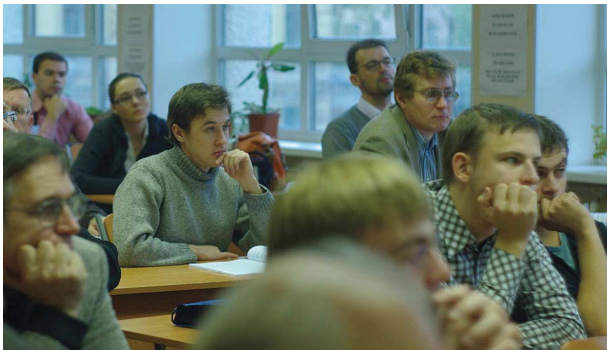
РИС. 6. На тематическом семинаре