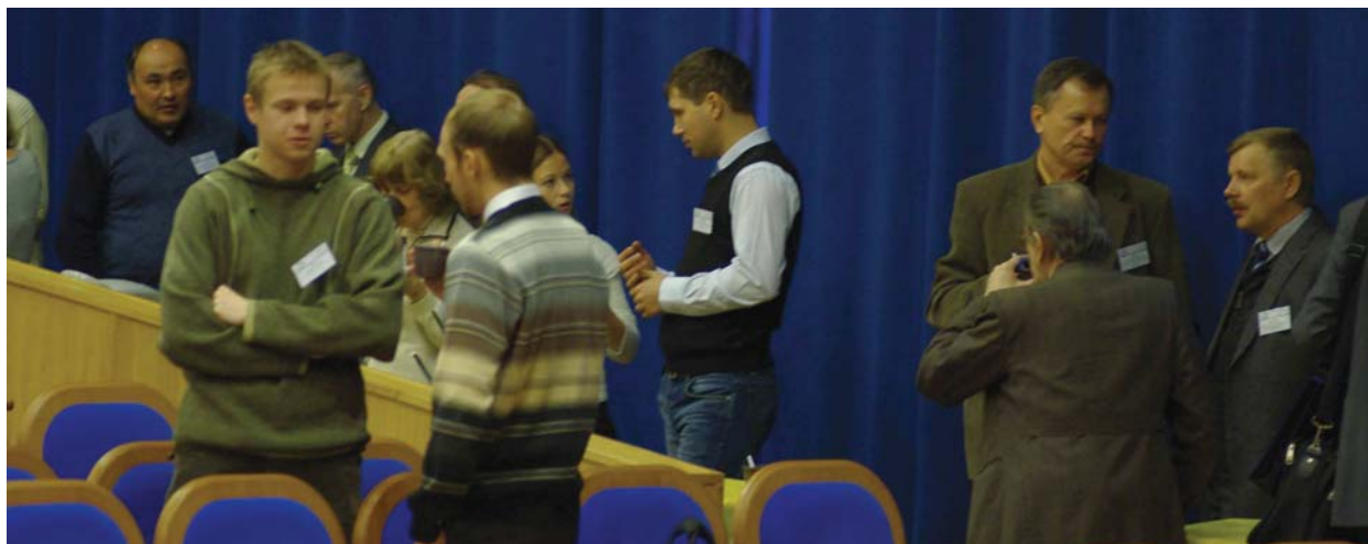
Рис. 4. В перерыве конференции

На секции «Когерентные процессы взаимодействия света с веществом» были заслушаны приглашенные доклады по следующим актуальным темам данного направления: когерентная оптическая томография, свойства оптических резонаторов с резонансно поглощающим веществом, когерентное взаимодействие света с атомным ансамблем, электромагнитно-индуцированная прозрачность и варианты управления световыми импульсами. На секции «Квантовая оптика и фундаментальная спектроскопия» обсуждались следующие темы направления: автомодуляционные колебания и стохастические эффекты, квантовые оптические информационные технологии, регистрация гамма-излучения на спутниковых аппаратах, оптическое поглощение нанографита и граффенов и др. На секции «Новые принципы оптической передачи, обработки и хранения информации» обсуждались вопросы распознавания объектов голографическими корреляторами, модели оптического транзистора и оптических систем с управляемым гистерезисом, оптической памяти на основе систем с квантовыми точками и др. На секции «Оптика фемто- и аттосекундных импульсов» большой интерес вызвал доклад о состоянии исследований об эффективном ускорении ионов и создании протонных пучков с использованием ультраинтенсивных сверхкоротких